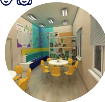
ЦЕНТРЫ ДЕТСКИХ ИНИЦИАТИВ